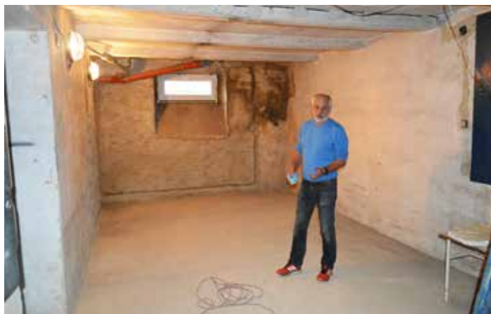
V této místnosti bude keramická dílna, ve vedlejších dvou prostor pro keramickou pec a herna na stolní tenis, ukazuje starosta