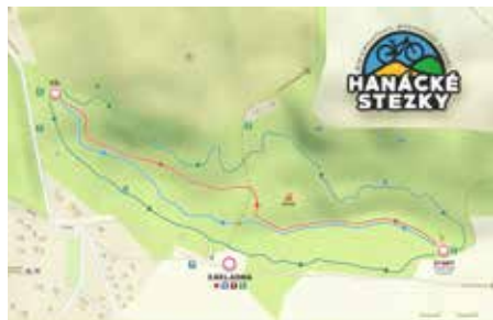
Uspěly také Hanácké stezky v Mostkovicích