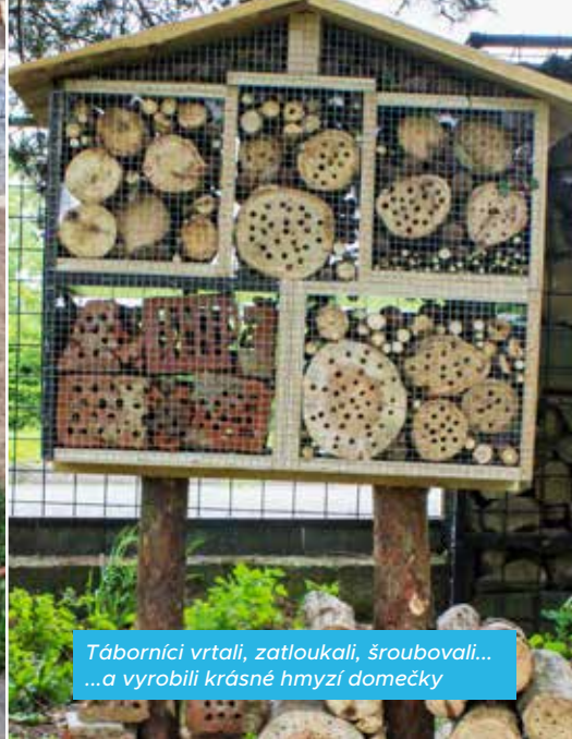
Táborníci vrtali, zatloukali, šroubovali... ...a vyrobili krásné hmyzř domečky