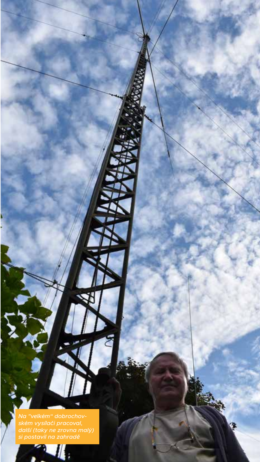
Na "velkém" dobrochovském vysílači pracoval, další (taky ne zrovna malý) si postavil na zahradě

Každá stanice má svůj volací znak – v začátcích si ho operátoři vymýšleli, teď už ho každý dostane přidělený. Když se připojíte k vysílačce a uslyšíte stanici, která volá výzvu, snažíte se zopakovat ten znak a k tomu odvysíláte svůj znak. Když vás stanice zaslechne, odpoví, že vás slyší. A dál už je to jednoduché: Na začátku se pozdravíte, jen si musíte udělat pořádek v tom, do které části světa voláte, jestli je tam ráno, odpoledne nebo večer. Pak řeknete své jméno, odkud vysíláte a jak se slyšíte. A většina spojení končí tím, že poděkujete a požádáte o QSL lístek. To jsou takové karty velké jako pohlednice, kterými si radioamatéři potvrzují navázaná spojení.